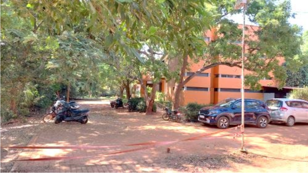
சையருக்கு பின்னால் வாகனம் நிறுத்துமிடம்

குறிப்பு - இதன் வரைபடம், புகைப்படங்கள் ஆகியவற்றுக்கு நியூஸ் அண்ட் நோட்ஸ் ஆங்கிலச் செய்தியைப் பார்க்கவும்.